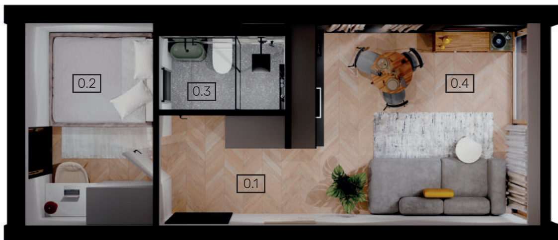
Układ funkcjonalny 1 26,68m 2