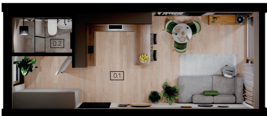
Układ funkcjonalny 2 27,10m 2